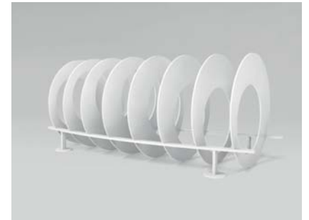
RAL 9010 Reinweiß