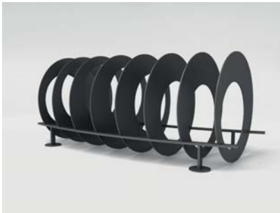
RAL 7016 Anthrazitgrau

Folgende Standardfarben stehen zur Wahl: