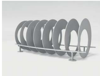
RAL 9022 Perlhellgrau