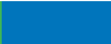
RAL 5015 Himmelblau